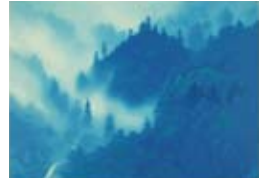
山崎湧雲(リトグラフ) Clouds Rising on Mountains

青の諧調、墨一色の濃淡。唐招提寺障壁画制作で水墨画への挑戦を成し遂げた魁夷の、色彩を抑えた作品の数々を紹介します。単色で描き出された風景の中に、深い静寂が広がります。