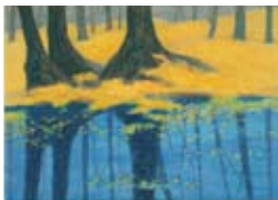
冬映(リトグラフ) Winter Reflections

魁夷の絵画制作は、ひとり自然と向き合うことから始まります。樹木の春夏秋冬の姿を知る魁夷のまなざしは、厳しさに耐える冬の樹木をねざらい、春の芽吹きを讃え、自然の中で共に生きる存在へ、親しみ深く語りかけています。