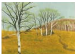
春丘(リトグラフ) Spring Hill

魁夷は信州の山々をこよなく愛し、四季折々に訪れては数多くの作品を生み出しました。魁夷が「作品を育ててくれた故郷」と慕う長野県の中に見る生命の可憐さ、力強さが感じられます。