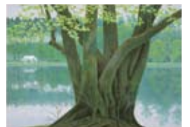
若葉の季節(リトグラフ) Season of Young Leaves

森の中に、緑の湖畔に、風吹く渚に、一頭の白馬が現れます。時には雲のように空を駆ける幻想も、魁夷の心の風景です。魁夷が、唯一動物を登場させた連作「白い馬のみえる風景」を中心に、白馬の描かれた作品を展示します。