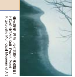
東山魁夷 東山(元中野五郎蔵) Hirao Kaito Akashi (Kaijushu Municipal Museum of Art)

強い関心が向けられ、海外への取材旅行にも訪れました。そして、異国から振り返りみる日本の自然美に、あらためて魅せられていきました。数々の旅をととして描かれた自然と風景の美しさを紹介します。