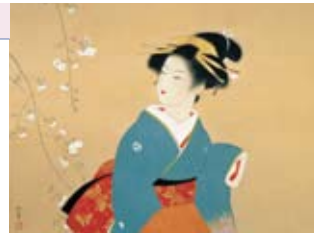
上村松園 櫻がり図【株式会社ヤマタネ蔵】 UEMURA Shoen Cherry-blossom Viewing, Yamatane Corporation

代表する22名の作家の作品を紹介します。伝統を継承しつつ新しい日本画を目指した画家たちが、明治の近代化とともに歩み育んだ、日本独自の美の世界をお楽しみください。