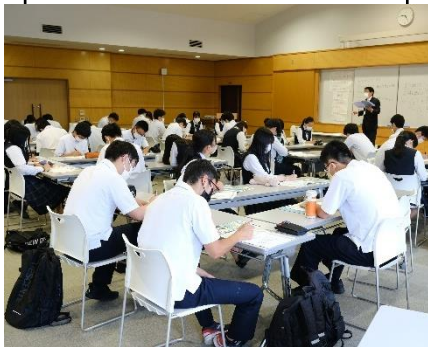
就職・進路ガイダンス