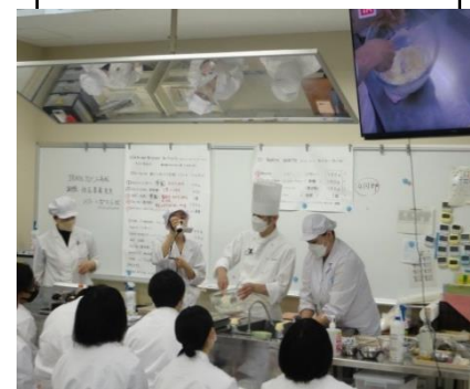
調理オンライン配信