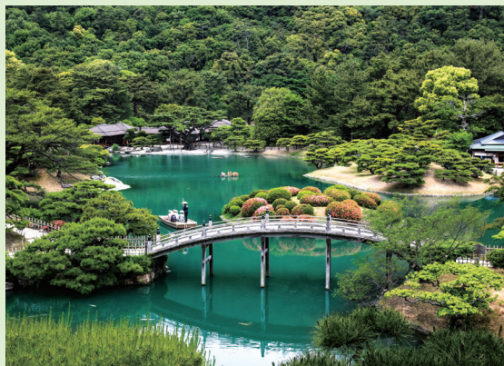
四季折々の風物を楽しめる回遊式大名庭園「特別名勝栗林公園」