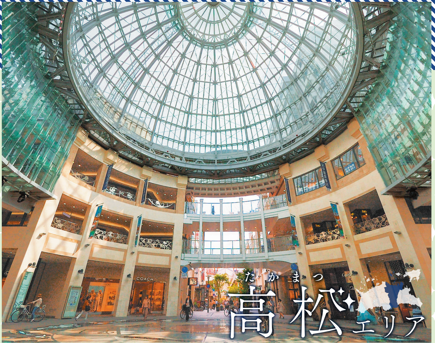
ショッピングやグルメを朝から晩まで楽しめる「高松中央商店街」