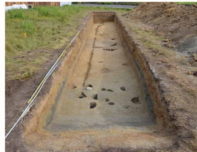
トレンチで見つかった柱穴跡や溝状遺構

遺跡を考える場合、土地が固く安定した丘陵上は集落を営むのに適するのに対して、水はけの悪い谷は水田（稲作）に適します。