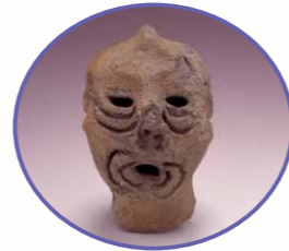
さぬき市鴨部・川田遺跡で見つかった弥生土偶 (弥生人の姿を写実的に表現)

展示会をご覧いただいた方々に、弥生土器が時間の流れ、地域の個性、人々の交流など、過去の様々な世界へ導いてくれること、つまり「弥生土器のミカタ（見方）」は、考古学者、いや私たちにとって未知の世界へ進んでいくための「弥生土器はミカタ（味方）」だと感じていただければ幸いです。