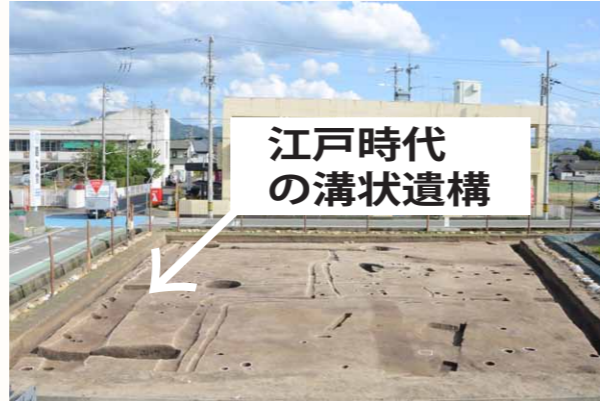
条里地割に平行する江戸時代前期の溝状遺構

この遺跡では弥生時代後期から江戸時代前期の溝状遺構や多数の柱穴跡などが見つかりました。はじめに室町時代から江戸時代前期の溝状遺構について紹介します。溝状遺構は隣接する市道に平行して複数条掘られています。これらは一部が重複しており、長期間にわたって何度も掘り直されたことがわかります。