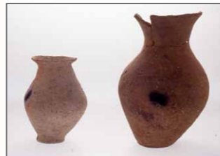
さぬき市鴨部・川田遺跡で見つかった弥生土器壺 (壺は水稲耕作の始まりとともに増加した。これは壺が主に稲の種もみを貯蔵する容器として使われたため)