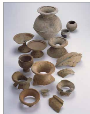
普通寺市旧練兵場遺跡に運び込まれた各地の土器（九州から関西までの地域で作られた）