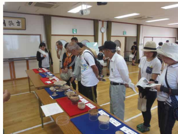
現地説明会遺物見学

これらのことから、この付近に人間が暮らし始めたのは弥生時代後期からで、鎌倉時代終わりごろまでに条里地割が施工される以前には河川があり、周辺は河川に面した低地であったことがわかりました。