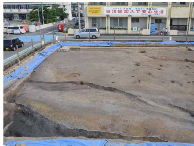
弥生時代後期の河川跡

遺跡周辺の道路や田んぼを見ると 1 辺約 109m 四方の碁盤の目状に区画されています。これは「条里地割」と呼ばれる土地区画整理の名残です。沖遺跡で見つかった溝状遺構は周辺の条里地割に平行しています。これは土地区画が踏襲されたことによるもので江戸時代、更に現代までこの区割りに沿って土地が利用されてきたこととなります。このうち最も古い溝状遺構からは鎌倉時代終わりごろの土師質土器が出土し、遅くともこの頃までにはこの付近の条里地割が施工されたことがわかりました。