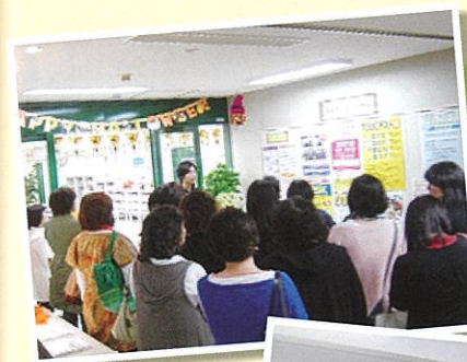
大学 専門学校訪問研修会 見学会

香川県高等学校PTA連合会を中心に先生方の「教え」と保護者の「育み」のもと、子どもたちのよりよい成長を支援するため、県内の高等学校PTA・特別支援学校PTAそれぞれが役割と責任を自覚し、様々な活動をおこなって、教育の振興と刷新に協力しています。PTA連合会は中四国、全国と広がりつなごっています。