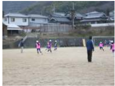
〈サッカー練習風景〉

放課後の特別練習（陸上・水泳・サッカー）を原則として、火・木・金曜日の週3回、16:00～17:30（夏季）16:00～16:50（冬季）とし、練習終了時刻を厳守するようにしている。また、指導を体育主任だけに任すのではなく、輪番制で上学年担任1名、少人数担当教諭の計3名で指導にあたり、体育主任の負担を軽減している。さらに、体育主任が担任する学級児童で、放課後、個別の支援・指導が必要な児童については、練習の指導を行わない上学年の担任が支援・指導を行うようにしている。