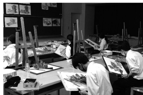
美術専門コース：授業の様子

美術専門コース ：美術系・教員養成系の大学などへの進学を目指すコースで、2年次より文系コースの中に設置されています。美術部の活動とも連動させて、実技の向上をめざしています。