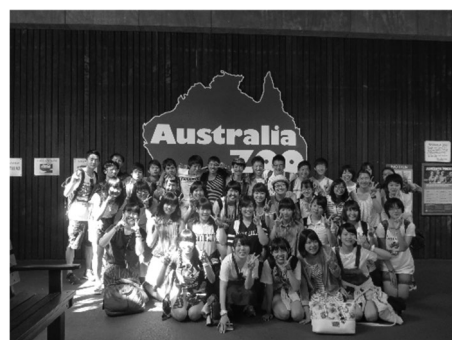
国際文科コース：オーストラリア

特別理科コース ：理系難関大学への進学を目指すコースです。平成22年度から令和元年度までの2期10年間、文部科学省からスーパーサイエンスハイスクール(SSH)の研究指定を受け、様々なプログラムを開発し充実させてきました。さらに、2020年度から新たに