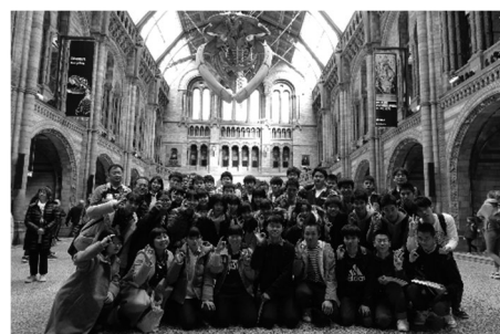
特別理科コース：イギリス