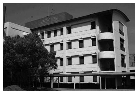
校舎棟（上）と音楽科棟（下）