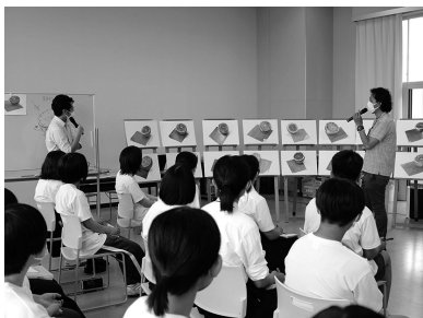
美術予備校による実技講習会

デザイン科では、実習、工芸絵画、工業技術基礎などの授業の中で、デザイン分野に必要とされる専門的な知識と技能を身につけるとともに、デザインに関する多くの科目をより専門的に学習しています。さらに、日頃の学習を深めるため、外部講師による講演会や県外研修なども実施しています。そして、これらの成果をデザイン科作品展をはじめとするさまざまな場で発表しています。また、専門性を高めるだけでなく、普通教科・科目を多く学習できる「国公立大学等への進学に対応したコース」を設けることにより、さまざまな進路希望の実現に努めています。また、課題研究では県内の市町等と連携して様々なデザインに取り組み、それらの活動が県に評価され、令和3年4月に知事表彰「かがわ21世紀大賞」を受賞しました。