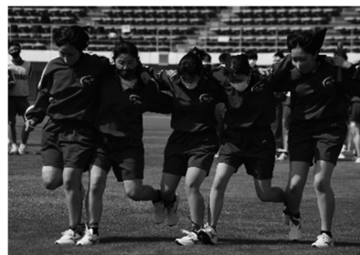
体育祭(Pikara スタジアム)

演劇 文芸 新聞 ESS 管弦楽 放送 美術 書道 写真 茶道 家庭 地歴 漫画研究 陶芸 野球 陸上競技 卓球 水泳 柔道 剣道 バスケットボール バドミントン 山岳 サッカー バレーボール ソフトテニス