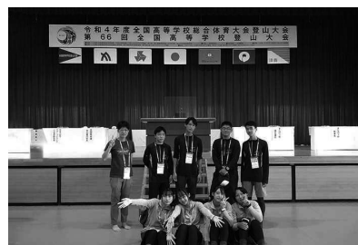
インターハイにて(山岳部)

演劇 文芸 新聞 ESS 管弦楽 放送 美術 書道 写真 茶道 家庭 地歴 漫画研究 陶芸 野球 陸上競技 卓球 水泳 柔道 剣道 バスケットボール バドミントン 山岳 サッカー バレーボール ソフトテニス