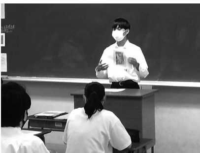
プレゼンテーション大会

さらに、地域の自治体等と連携した探究的な学習に取り組んでおり、自立した社会の一員として自ら課題を見つけ、主体的に社会に参画する態度を育成するため、「他者と協働して課題を解決しようとする学習活動」を積極的に進めています。