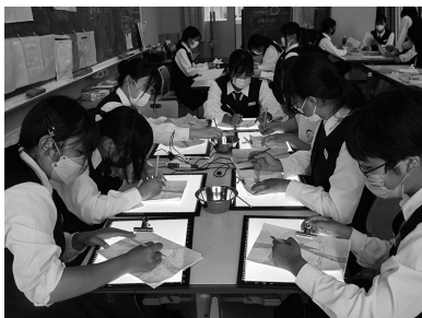
課題研究 制作風景