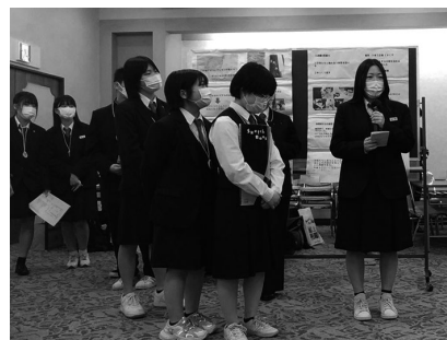
四国高校生探究活動発表会(1年)