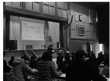
探究最終報告会(2年)