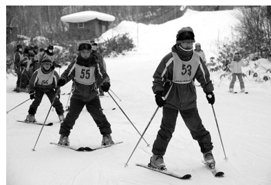
スキー研修(修学旅行)

生徒会を中心として文化祭、体育祭、球技大会などが企画・運営され、これら多彩な行事が青春の1ページを鮮やかに飾っています。また、毎年、各界で活躍している卒業生を講師に招いて教養講座を実施し、豊かな人間性の育成を図る機会としています。