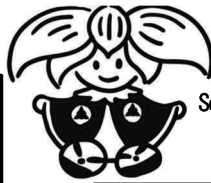
School マスコット ハナミズキちゃん