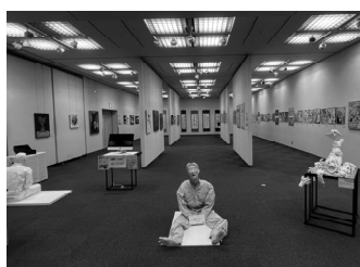
芸術コース作品展・演奏会