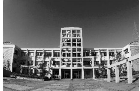
大学のような威風堂々とした校舎 (生徒を中心とした設計に感動)

現在、創立30周年に向かって、高き理想を掲げた学校創立の精神を大切にしながら、これまで以上に「地域で一番行きたい高校」として、新たな飛躍をとげるため、三木町と包括連携協定を結び、更なる魅力づくりに取り組んでいます。自分を発見し、夢実現に向かって邁進できるよう、ICT活用も含めた新しい授業の構築、地域と連携した探究活動やボランティア活動、多くの外部人材を活用した取り組みなどを新教育課程に沿って推進しています。また、語学研修や留学生の受け入れなど国際理解教育も充実しており、ローカルからグローバルまで幅広い視野をもった人材育成をめざしています。以上のように、これからの未来を創る新たな「主役」となる生徒を求めています。