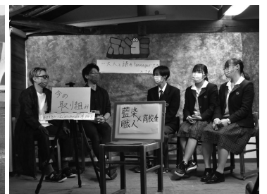
ふらコミスクエア ～大人と語るTEENたち～