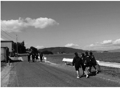
チャレンジウォーク (10月)