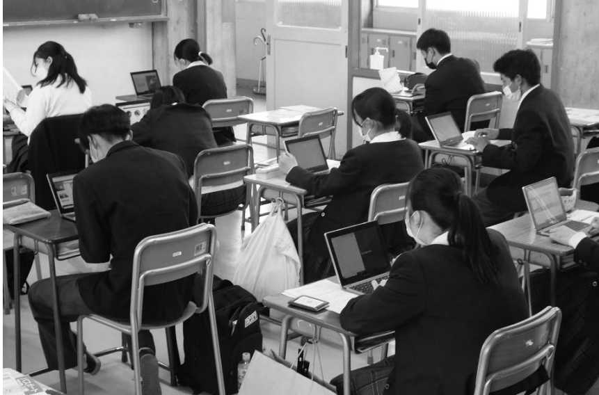
タブレット端末を使った授業