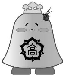
90thマスコットキャラクター コンコるん

今年で創立95年目を迎えた本校は、昭和4年の創立以来、約2万名の卒業生を送り出してきた東讃の伝統校です。学校は雨滝山の深い緑を背に“津田の松原”を眼前にした、静かで落ち着いた環境の中にあります。校内にも緑が多く、庭園に設置された、平和と団結の象徴である「コンコルディアの鐘」の音が毎日心地よく校庭に響き渡ります。津田高校は恵まれた環境の中で、 自分の可能性にチャレンジできる ところです。校訓「 勤勉・希望・気品 」のもと、生徒たちは自分の夢や希望に向かって、意欲的な学校生活を送っています。