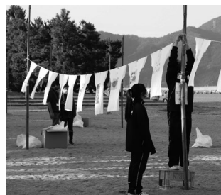
すなはまフェスティバルの準備

TDあくてい部の生徒を中心に希望者が、地域のイベントの企画や当日の運営にボランティアとして参加したり、地域で活躍する大人と対談する活動の運営などに関わることを通して、地域活性化に取り組む大人や外国人との交流を深め、コミュニケーション力を高めたり、視野を広げたりするなど多くのことを学んでいます。