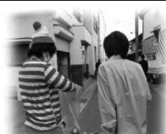
ハロウィン仮装清掃