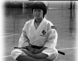
ステップアップクラス