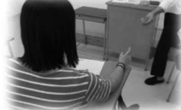
オンラインスタイル

毎日登校するか、普段は働きながら月に1度の日曜日や集中スクーリングで登校するかが選べます。