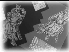
マイスタイルクラス