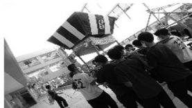
校内マラソン大会