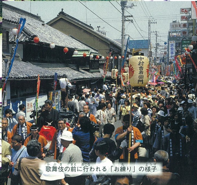
歌舞伎の前に行われる「お練り」の様子