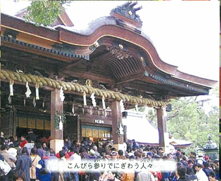
こんびら参りでにぎわう人々